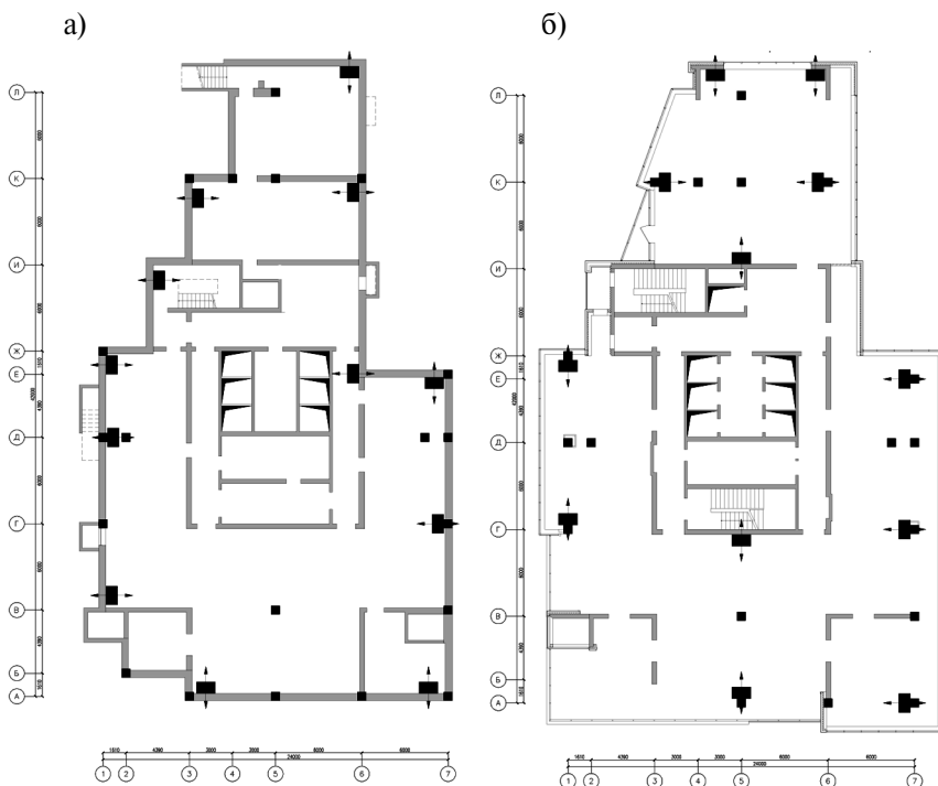
Рисунок 3. Схемы размещения датчиков первичного сбора и обработки информации в плане объекта мониторинга на I (а) и II уровнях (б)

Подключение первичных датчиков к центральному блоку системы было осуществлено по кабелю типа «витая пара», обеспечивающему полосу пропускания сигналов со скоростью не менее 100 МБ/с. В целях предотвращения несанкционированного доступа центральный блок системы был размещен в помещении с круглосуточным пребыванием персонала стройки. В основе функционирования автоматической системы мониторинга, использованной на объекте, лежит принцип определения отклонения установочной базы датчика от нормального положения по данным угловых измерений. При этом непосредственно после установки было осуществлено обнуление сигналов датчиков, что соответствовало начальному углу установки, после чего система сравнивала вновь поступающие сигналы со значениями на момент инициализации датчиков, то есть значения на момент инициализации использовались системой при расчете значения угла отклонения.