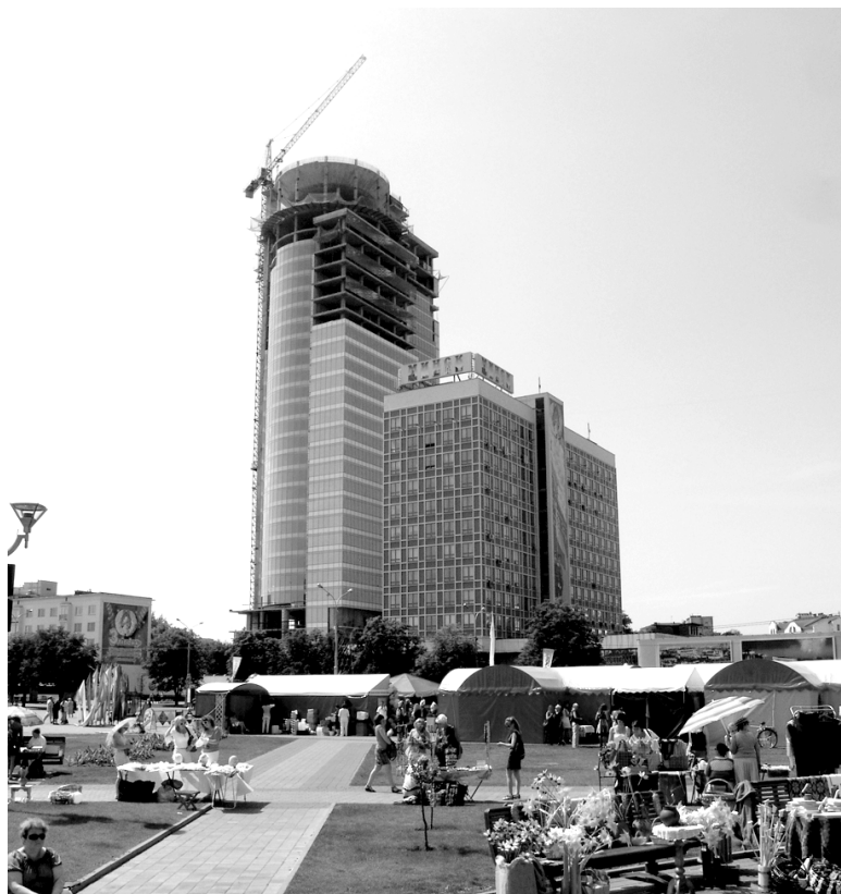
Рисунок 1. Административно-торговый центр по пр. Победителей, 7 г. Минск

Участок для строительства объекта мониторинга расположен в смешанной застройке центральной части Минска, вдоль пр. Победителей, с развитой транспортной сетью в непосредственной близости от станций метрополитена («Фрунзенская»), на месте бывшего кафе «Реченька» возле магазина «Ромашка».