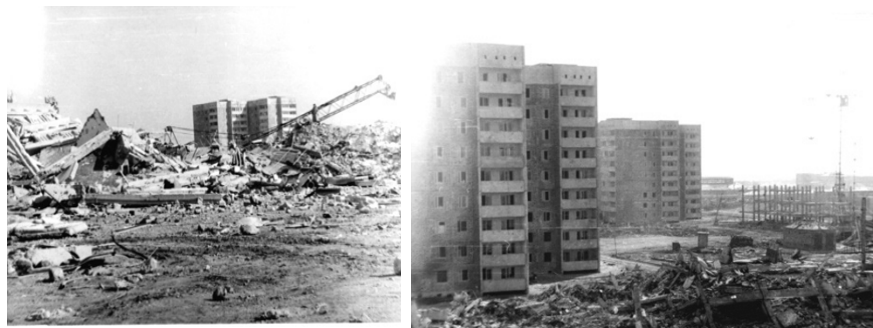
Рисунок 2. Разный уровень уязвимости для зданий различных конструктивных схем (Спитак, 1988)

Из общего числа современных многоэтажных зданий обрушились или сильно пострадали в Спитаке – 87%, в Ленинакане – 52%, в Кировакане – 24% (рисунок 2).