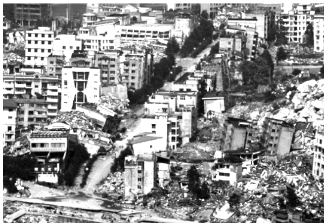
Рисунок 1. Общий вид разрушенных и уцелевших зданий (г. Нефтегорск, 1995; провинция Сычуань, Китай, 2008)